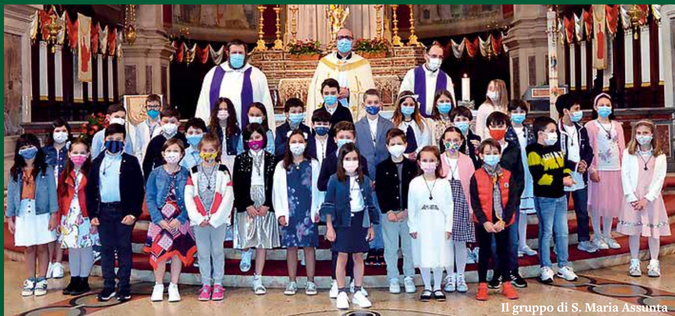
Il gruppo di S. Maria Assunta

G esù racconta nella parabola l'episodio di un pastore che ha cento pecore, ne perde una, la cerca e ritrovata la prende in spalle. Ognuno di noi è questa pecora che a volte testarda vuol far di testa sua percorrendo strade che ci allontanano dalla vita.