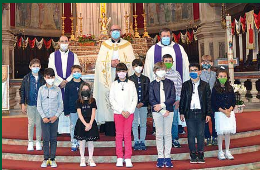
Il gruppo del Sacro Cuore

Per alcuni adulti è stato il momento anche di accostarsi al sacramento della confessione, testimoniando che nel perdono di Dio ci si sente amati e come dice Gesù: "Le sono perdonati i suoi molti peccati, poiché ha molto amato. Invece quello a cui si perdona poco, ama poco". (Luca 7, 47)