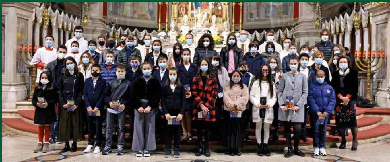
Il 2° gruppo di S. Maria Assunta - Sacro Cuore