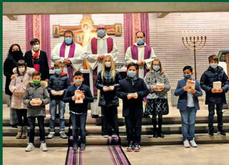
Il gruppo di San Paolo in San Rocco