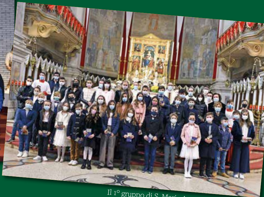
Il 1° gruppo di S. Maria Assunta - Sacro Cuore