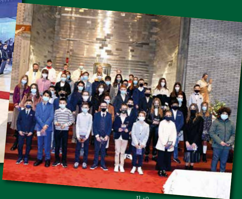
Il 1° gruppo di San Giuseppe