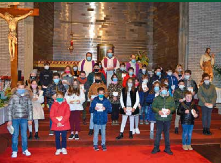
Il gruppo di San Giuseppe