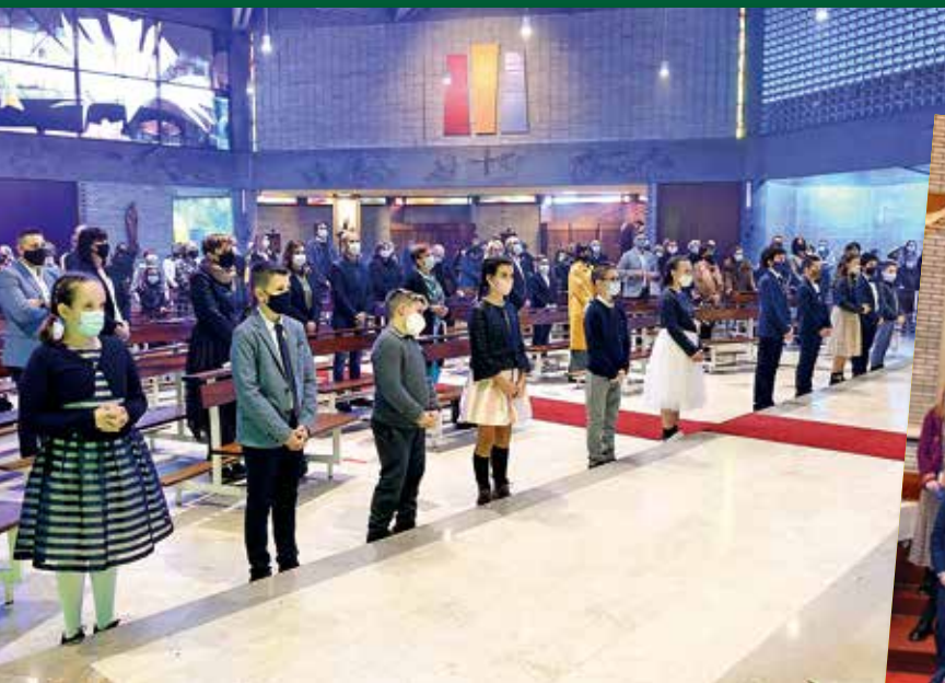
Il gruppo di San Paolo in San Rocco