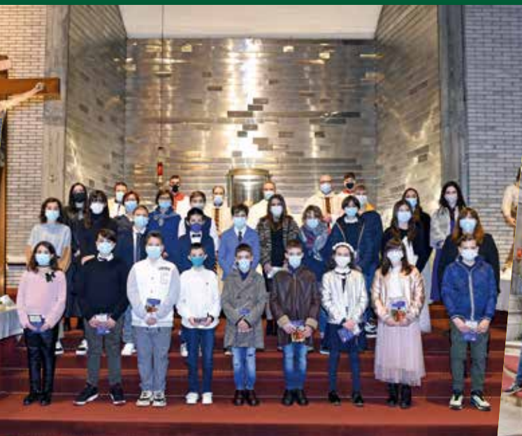
Il 2° gruppo di San Giuseppe