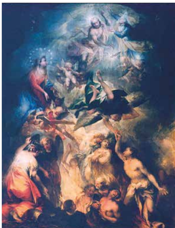
LA VERGINE CHE INTERCEDE PRESSO DIO LA LIBERAZIONE DELLE ANIME PURGANTI

ta apprezzabile. L'offerta consegnata al Parroco, se non ci sono indicazioni altre dell'offerente, contribuisce alla retribuzione che si dà ai sacerdoti per il loro ministero tra noi; essi a loro volta con coscienza e responsabilità ne fanno uso per interventi di carità e per le esigenze della parrocchia. È anche per questo che, nonostante alcune consuetudini pastorali hanno dato indicazioni di cifre, è bene che l'offerta rimanga libera, così come per ogni celebrazione di altri Sacramenti o sacramentali. Anche nelle nostre comunità c'è l'attenzione a far celebrare volentieri Messa per i propri defunti. Quando poi il defunto è particolarmente noto, benvenuto e di famiglia numerosa, l'impegno per celebrazioni di Sante Messe, può occupare buona parte del calendario solo per lui. Altri, di anno in anno, chiedono una serie di S. Messe che ritroviamo puntualmente di frequente in calendario.