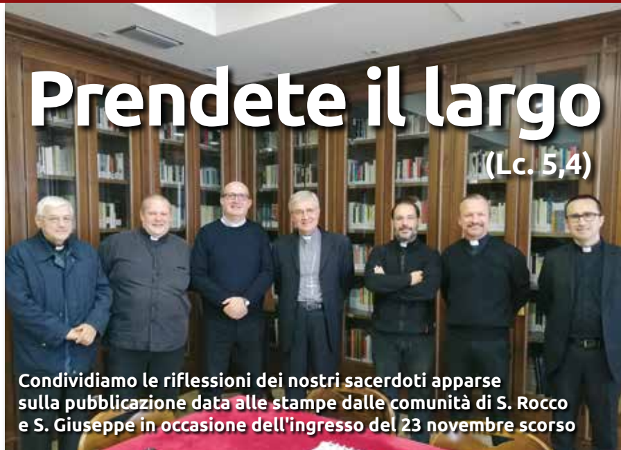
Condividiamo le riflessioni dei nostri sacerdoti apparse sulla pubblicazione data alle stampe dalle comunità di S. Rocco e S. Giuseppe in occasione dell'ingresso del 23 novembre scorso

di “guardare avanti”, perché il Signore ha sempre in serbo “cose nuove” (Ap 21,4-5) ed è “fedele alle sue promesse” (At 13,23)! A un certo punto, però, se non vogliamo rischiare di infrangerci tra scogli e secche, sarà il momento di mettere la prua verso l’orizzonte e “andare” (Mc 16,15), come il Risorto ha chiesto prima di lasciare i suoi al vento del suo Spirito (Gv 20,22). Le quattro vele siano tutte spiegate e ben fissate al pennone. Saremo tutti “sulla stessa barca”. Aiutiamoci a essere equipaggio profetico: ce lo chiedono il tempo presente e, ancora di più, le giovani generazioni, che non saranno benedette dalla presenza di tanti preti come noi oggi. L’entusiasmo sarà forza per tutti, “gareggiare nello stimarci a vicenda” (Rm 12,10) provocherà un contagio positivo, la condivisione dell’esperienza di navigazione diventerà un dono... Remare contro sarà rallentare il procedere, tenere ammainate le vele per capriccio sarà un affronto imperdonabile allo Spirito, anarchia e ammutinamento saranno la fine... Non sarà facile: è scritto nel Vangelo e nella millenaria storia della Chiesa. Forse saremo obbligati a gettare in mare parte della stiva, oltre a quello che già abbiamo lasciato sulla