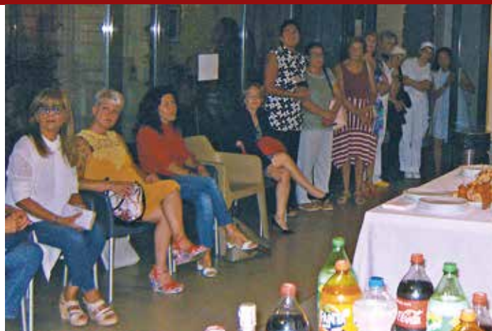
Il benvenuto al nuovo Consiglio.

L a Residenza Sanitaria Assistenziale don Ferdinando Cremona dispone di 75 posti letto dei quali 70 accreditati con contributo regionale e 5 autorizzati con rette a totale carico dell'utente ed eroga: assistenza al domicilio in regime di R.S.A. Aperta Misura 4 a persone anziane affette da malattia di Alzheimer o altra forma di demenza; pasti al domicilio distribuiti dai volontari dell'Associazione Cor Unum; prestazioni di fisioterapia per esterni in regime di solvenza; miniappartamenti presso l'immobile denominato "Madonna". Nel 2018 sono stati erogati 750 minuti settimanali per ospite su posto letto autorizzato e circa 1.140 minuti settimanali per ospite su posto letto accreditato rispetto ai 901 richiesti per questi ultimi dalla Regione. Come sappiamo, la Casa di Riposo è nata nel 1899 per opera di don Ferdinando Cremona il quale, acquistato un vecchio immobile accanto al Santuario di N.S. di Lourdes, con offerte dei parrocchiani e risorse personali lo trasformò nell'edificio adibito a "Ricovero per vecchi" che nel testamento redatto l'8 settembre 1912 individuò quale suo unico erede. L'art. 20 dello Statuto stabilisce che "la Fondazione è costituita senza limite di durata. Quando lo scopo è esaurito o ne è divenuta impossibile l'attuazione o sia di scarsa utili-