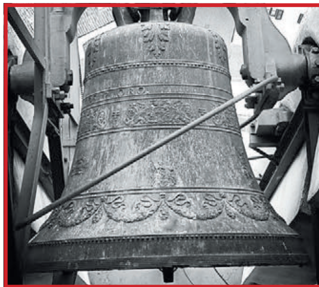
Quarta maggiore, campana da morto, peso 1048 Kg, riporta la scritta: ploro defunctos (piango i defunti)

I sacerdoti sono sensibili a questo importantissimo patrimonio e promuovono il suono manuale delle Solennità; il segnale delle messe mattutine con campanelle a festa; il suono che annuncia la morte di una persona (con tre serie di due rintocchi per la morte di un uomo o tre serie di tre rintocchi per la morte di una donna, seguiti dal suono della campana che «piange i morti») e i suoni solenni e gravi che